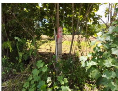
แนวเวนพื้นที่ทำเหมือง