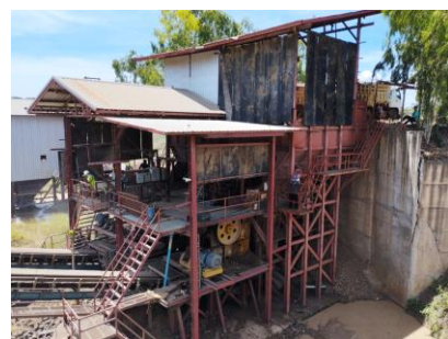
พื้นที่โรงโม่หินของโครงการ